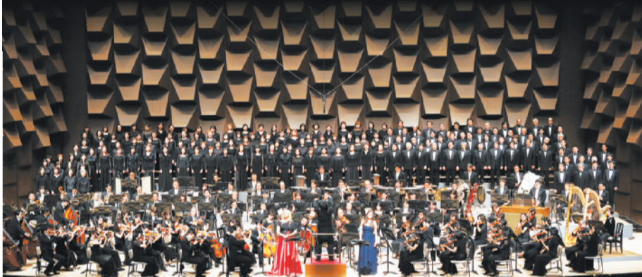
「復活」を演奏する大阪フィルハーモニー交響楽団と合唱団：2013年

1888年から6年を費やし、94年、マーラー34歳の年に完成。この間、両親や妹を亡くしている。第5楽章で死からの復活を歌う歌詞は、ドイツの詩人・クロプシュトックの詩にマーラーが手を加えた。初演は95年、マーラー自身が指揮した